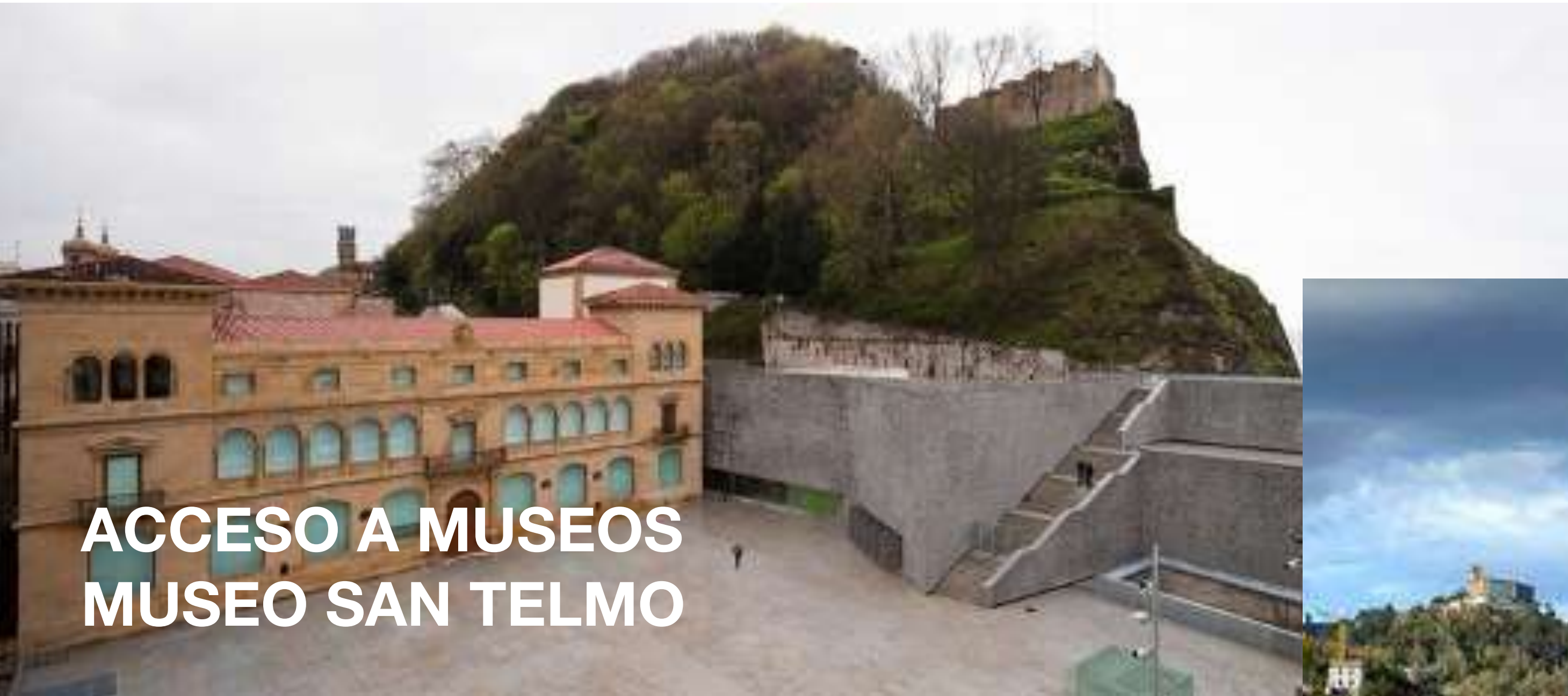
ACCESO A MUSEOS MUSEO SAN TELMO