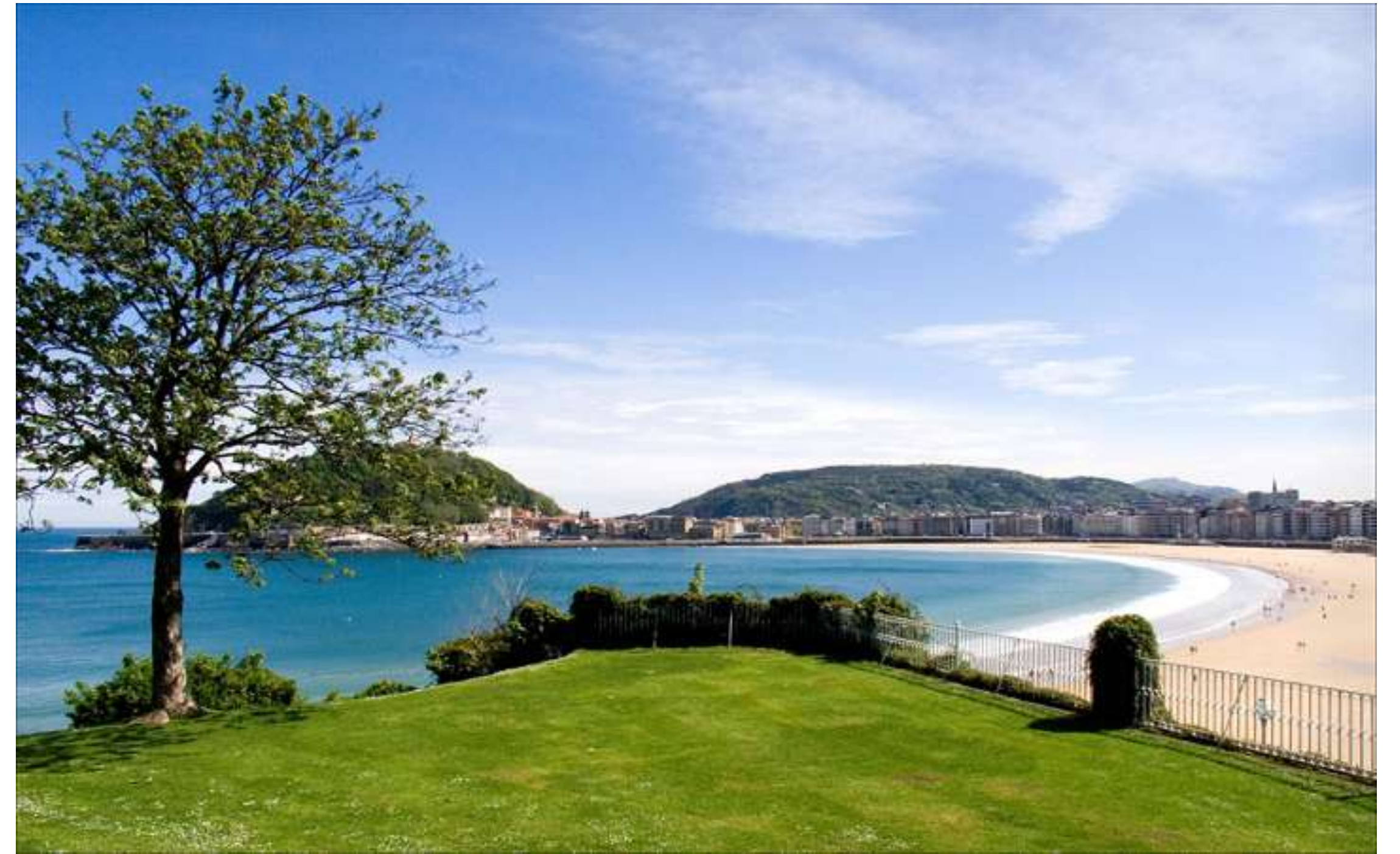
PALACIO DE MIRAMAR