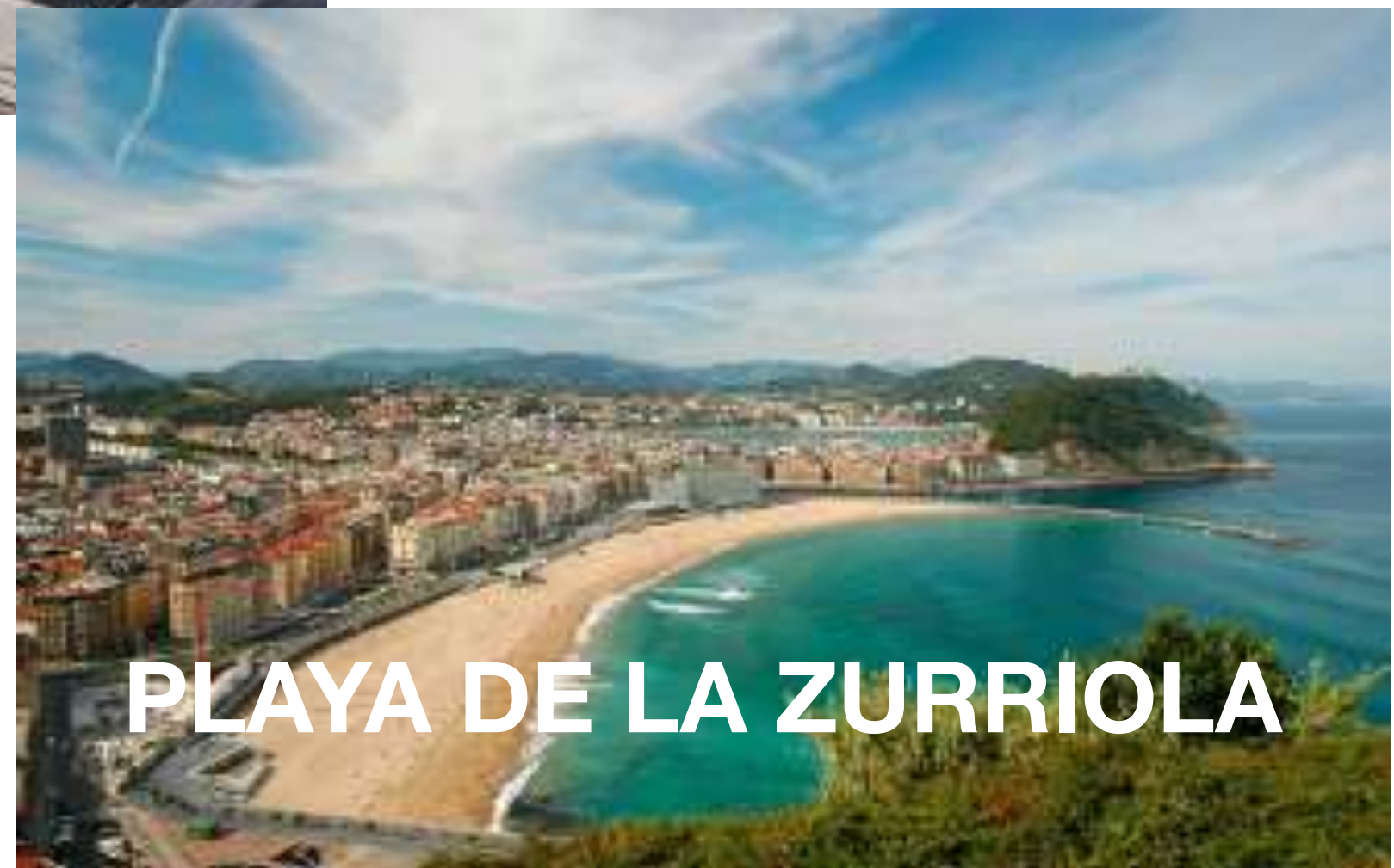
PLAYA DE LA ZURRIOLA