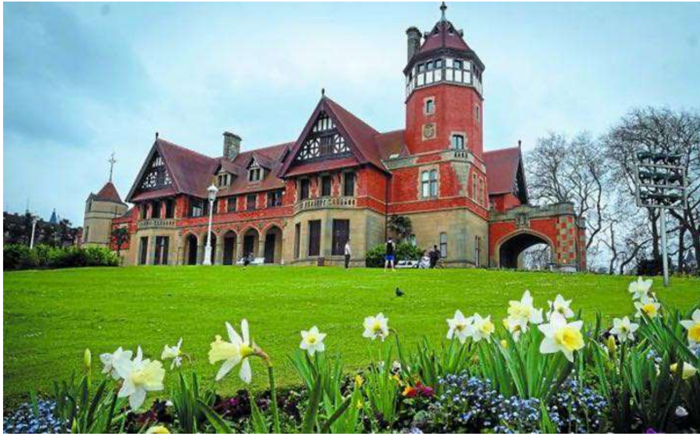
PALACIO DE MIRAMAR