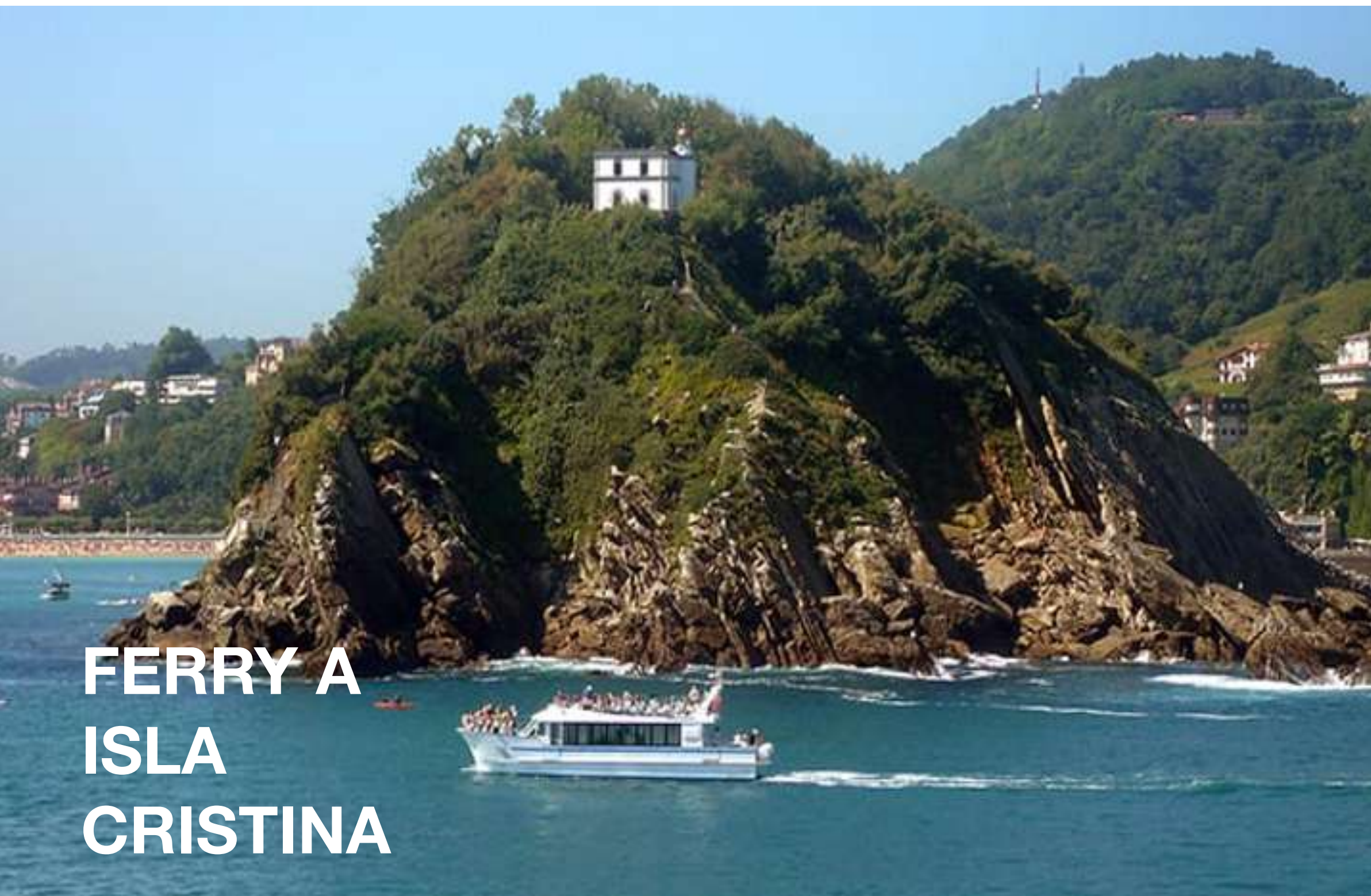
FERRY A ISLA CRISTINA