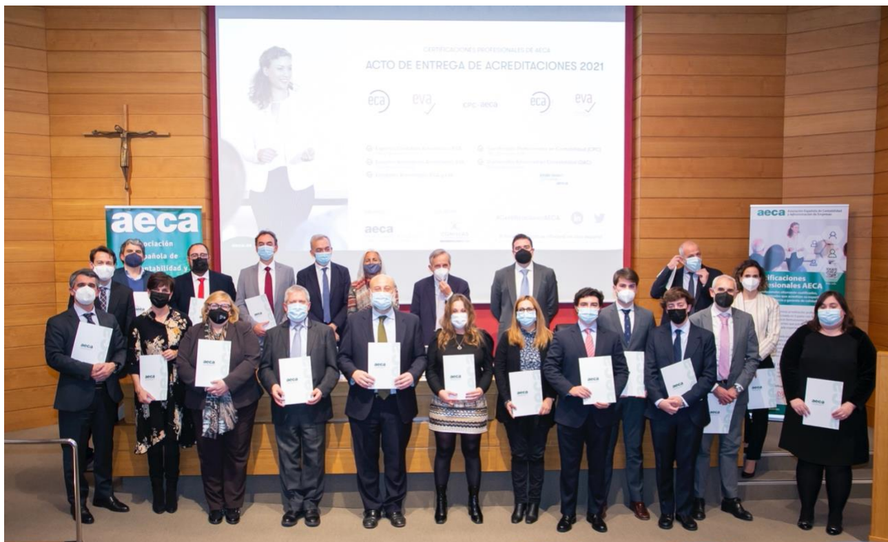
Expertos ECA®, EVA® y participantes del DAC asistieron al Acto de Entrega de Acreditaciones 2021 de AECA en la Universidad Pontificia Comillas