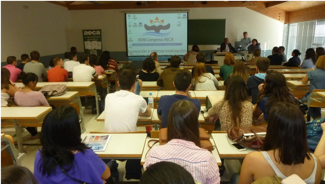
Aspecto de la sesión de estudiantes 2015, donde intervinieron representantes de los profesores, estudiantes, economistas profesionales y AECA.

El evento ofrece además unas becas que permiten a todos los estudiantes interesados asistir y participar por solo 40 euros, tanto de forma presencial como online.