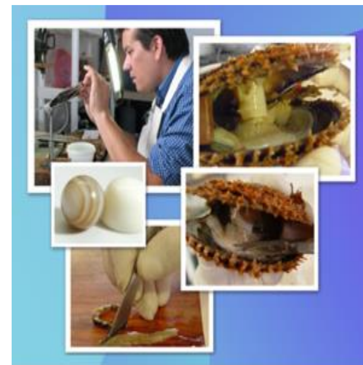
Imagen 3. Operación de Injerto.

La mayoría de los técnicos emplean alicates de acero inversos para forzar la apertura de sus ostras perladas. Forzar la apertura de las ostras causa mucha mortalidad (dependiendo de la especie, entre 30 y 70%). El método patentado de la granja reduce la mortalidad a solo 0%, y una vez abierto podemos proceder a realizar la delicada operación.