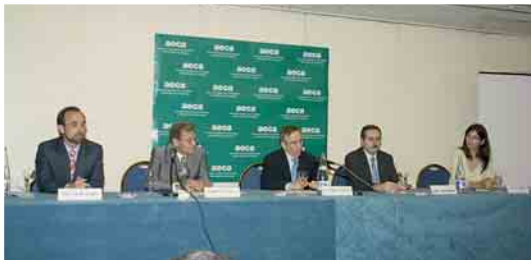
Actos de entrega de diplomas del Programa

Finalizada la Beca, el estudiante que lo desee podrá incorporarse a la Asociación como socio numerario, con los mismos derechos y obligaciones que el resto de miembros, exento de la cuota de inscripción.