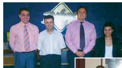
Estudiantes ganadores del Premio AECA para Entrevistas a Empresarios y Directivos de ediciones anteriores, junto a los entrevistados