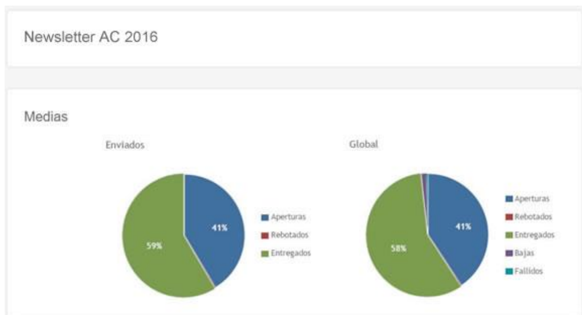
Tabla 1.- Evolución del porcentaje de correos vistos entre enero de 2012 y noviembre de 2016.