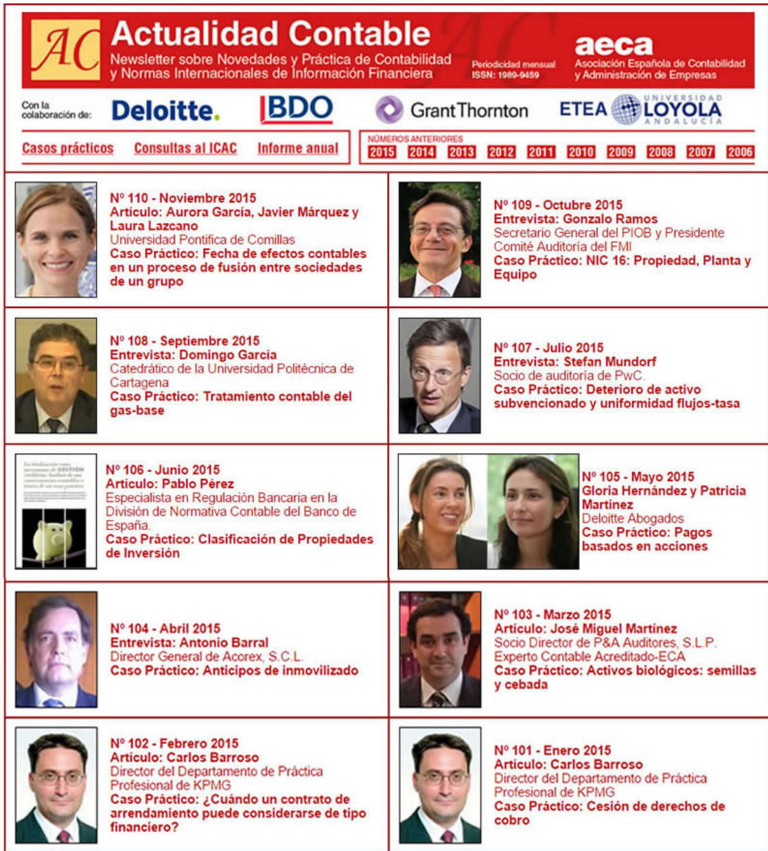
Tabla 4.- Panel de firmas y entrevistas en 2015.

4.- Noticias y Artículos: Es una selección de noticias, entrevistas y artículos de opinión de los principales diarios y revistas españolas.